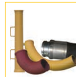
钢管, 变径管, 软管