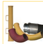
钢管, 变径管, 软管