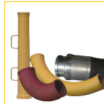
钢管, 变径管, 软管