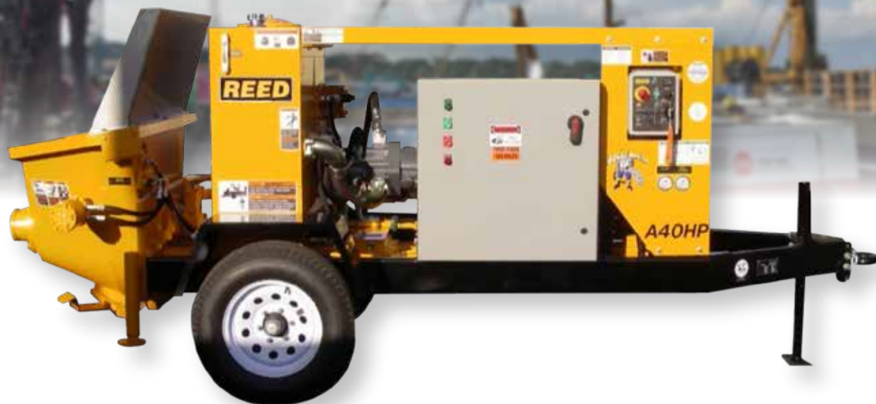
Bơm bê tông