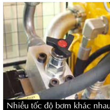
Nhiều tốc độ bơm khác nhau