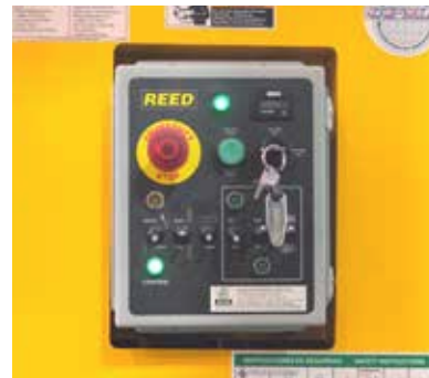
Bảng điều khiển dễ sử dụng