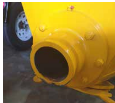
Đường kính đầu ra 5 inch